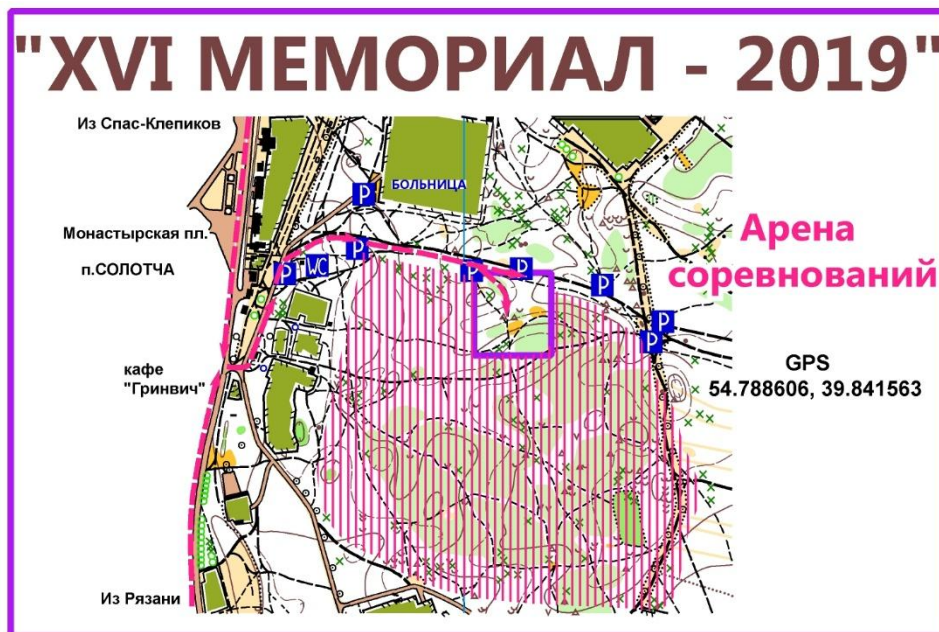
Схема Арены соревнований XVI «МЕМОРИАЛ-2019»